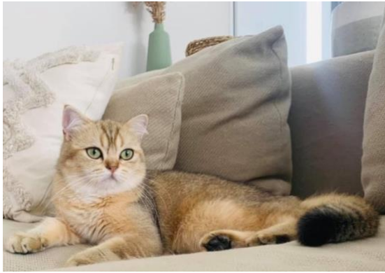
93 : RHÉA DE TOUARIT