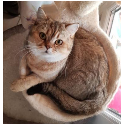
N° 13 : HILLSBURY'S ROMARINE