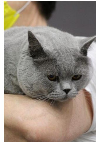
N 9 :AVICII VOM BLAUEN SAPHIR

Best of Best : n° 9 SH : - AVICII VOM BLAUEN SAPHIR