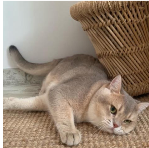
N° 92 : FABIO VOM COSTA SMERALDA