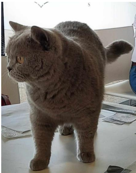
N° 66 : POEMA D'OCEA DES 4 COINS DU MONDE