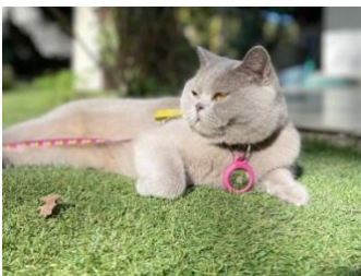
N° : 126 : POUPSY DE BRITAFOLIE

Best of Best : n° 9 SH : - AVICII VOM BLAUEN SAPHIR