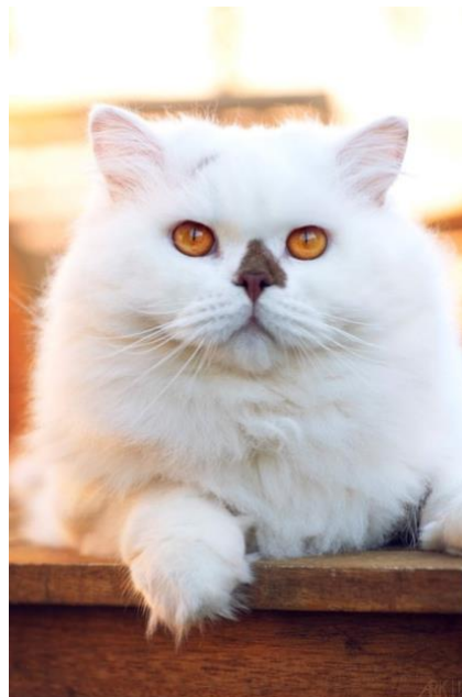
N° 5 : WINTER FELINE CHRISTI

❖ appréciations globales sur les sujets présentés (les cases sont extensibles, vous pouvez passer sur deux pages si besoin est ...) :