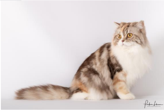
N° 7 : MELODY DES PTIS KACHOTIERS