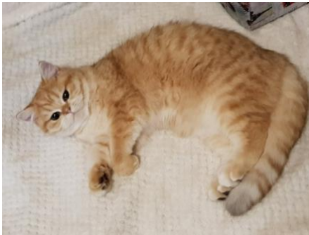
N° 12 : HILLSBURY'S SOLINE