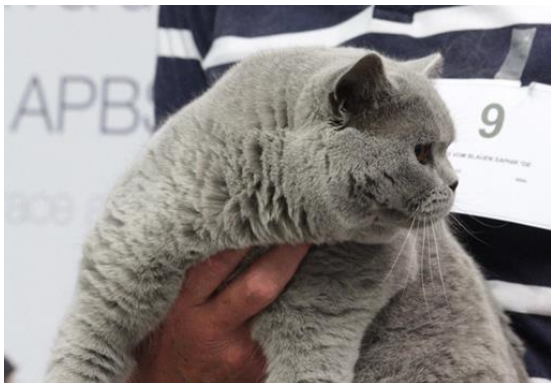
N° 9 : AVICII VOM BLAUEN SAPHIR