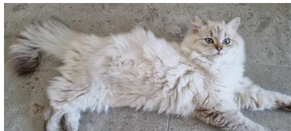
N°71 : SALTO DES BRITISH COCOON