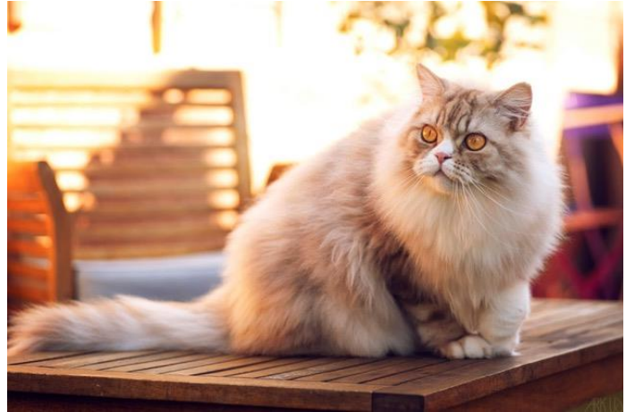
N° 6 : POPEARTH CHAMPAGNE STAR CHANCE